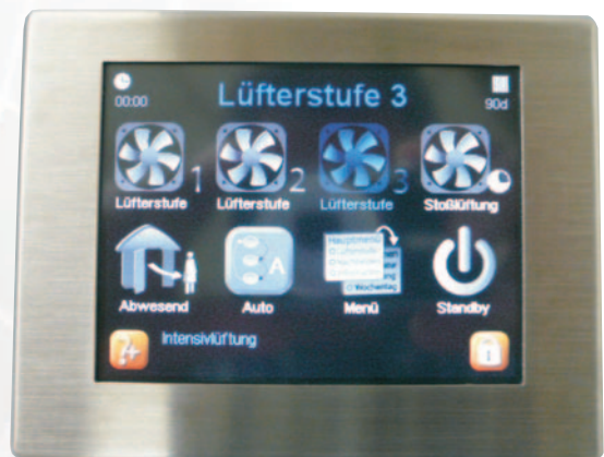
Komfort-Eingabe- und Bedienteil (multicolor TFT-TouchScreen)